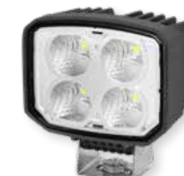
HELLA Power Beam S