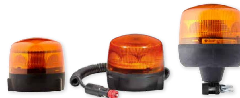
Rota LED rotorblink