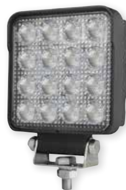
HELLA VALUEFIT S2500

Et lygteprogram i alternativ kvalitet som lever op til HELLA's kvalitetsstandarder. TR og TS serien er med Thermo-management - en termosensor der beskytter lygten for overophedning og sikrer lang levetid.