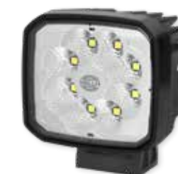
HELLA Ultra Beam S