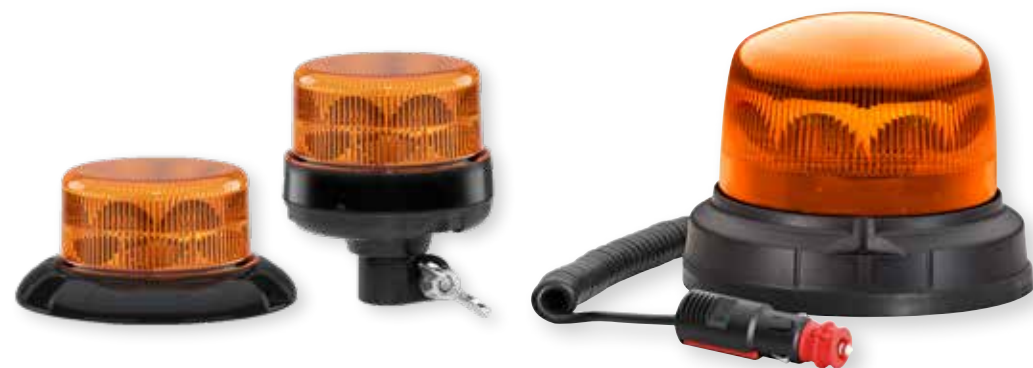
Nano K-LED blitzblink