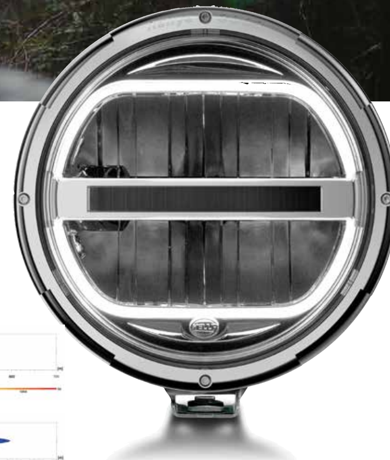
HELLA Rallye 3003 LED