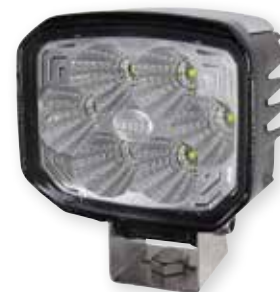
HELLA Power Beam 1500

En verden til forskel. Arbejdslygter til ethvert formål. Den nye S-serie er selvfølgelig også med Thermo-management.