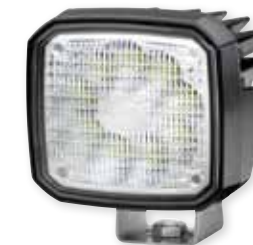
HELLA Ultra Beam II