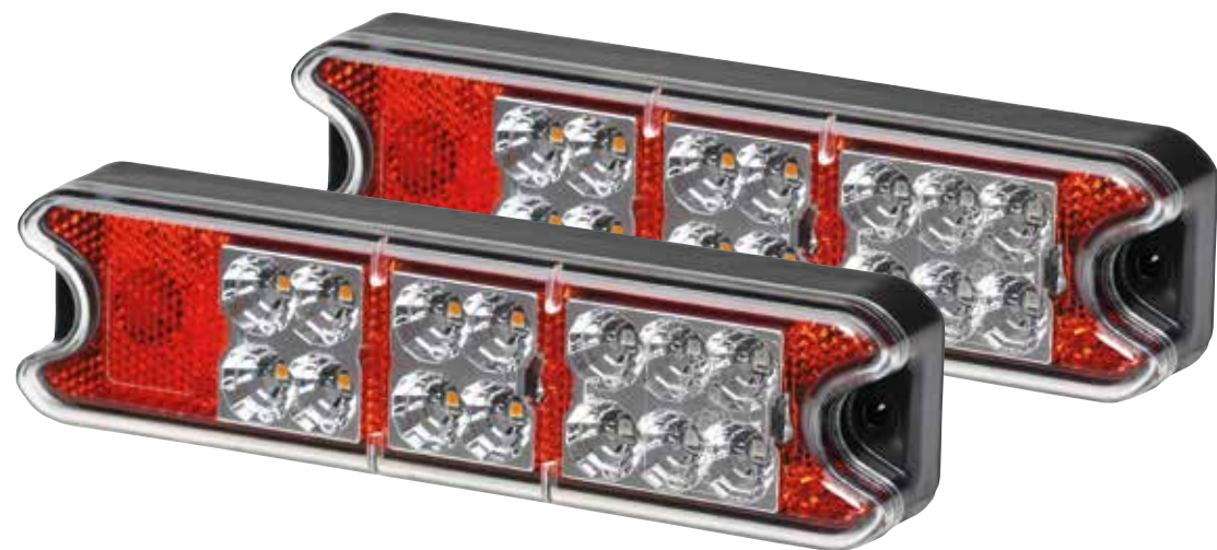
HELLA MULTIFIT LED baglygte