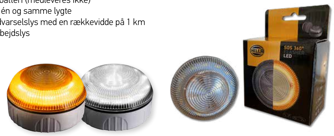
HELLA LED SOS 360