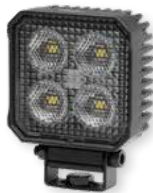
HELLA VALUEFIT TS1700