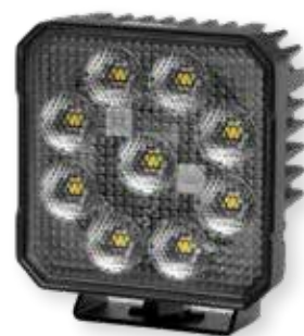
HELLA VALUEFIT TS3000