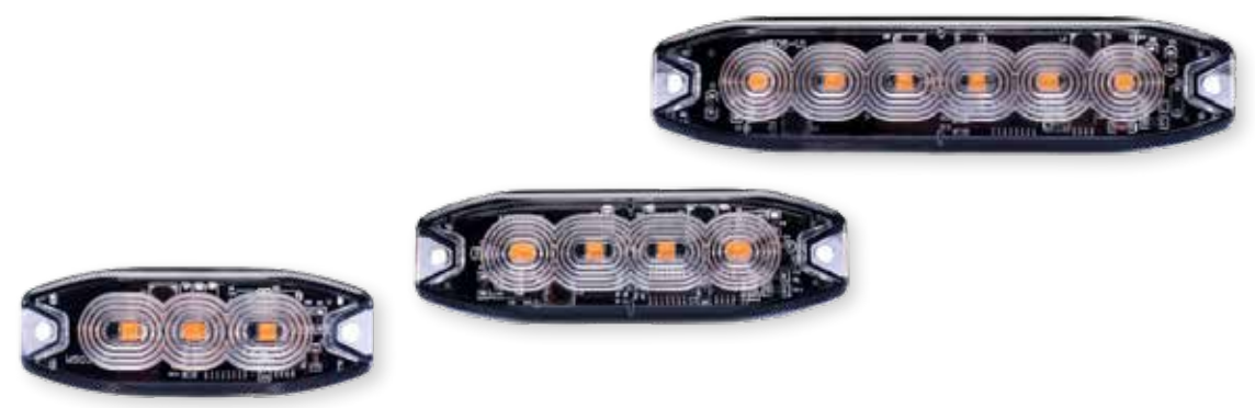
AF TLED3A AF TLED4A AF TLED6A